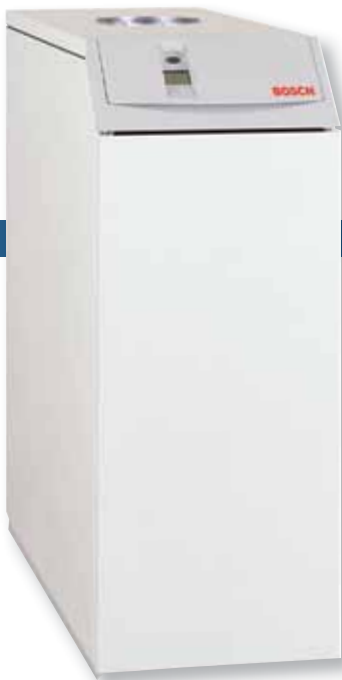
◀ Bosch EHLE-ketel

Een EHLE-ketel én een EBU-boiler van Bosch vormen een krachtige combinatie voor een comfortabel binnenklimaat en heel veel warm water in de badkamer en de keuken. Een combinatie waarop u blind kunt vertrouwen. Dag in, dag uit!